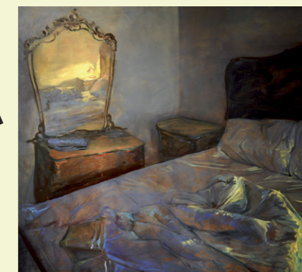
ANCA BODEA Last night in Venice, ulei pe pânză, 2012, 135x135cm