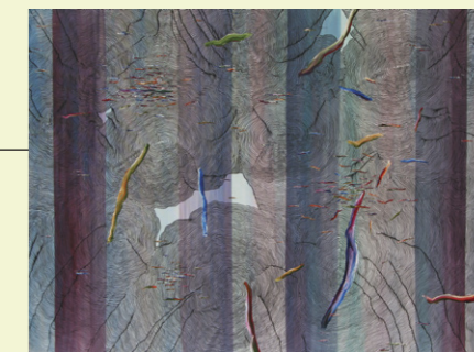
PETRICĂ ȘTEFAN Topographic Circles, 2016, 200x150cm